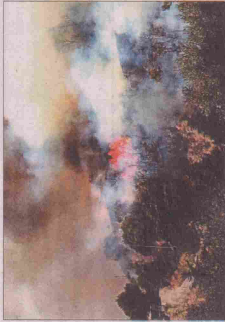
Incendio manda in cenere ettari di bosco a Villa Anche il sindaco di Magione sul luogo dell'incendio

razioni, lavorando in prima persona, per la salvaguardia delle proprie abitazioni minacciate dalle fiamme. Fondamentale anche l'intervento della municipale e della Misericordia di Magione che hanno messo in salvo un disa-